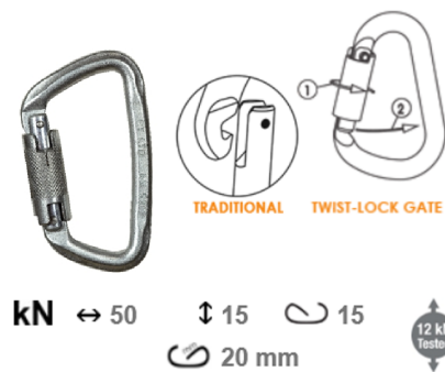
Fig. 2 Connecteur pour ancrage dorsal HAR013/018/024