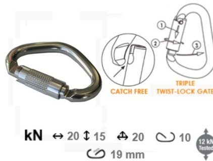
Fig. 1 Connecteur pour ancrage sternal HAR015

Les connecteurs utilisés sur la longe, répondent à la norme EN362. Les modèles de connecteurs qui sont homologués pour être attachés à la longe sont les suivants :