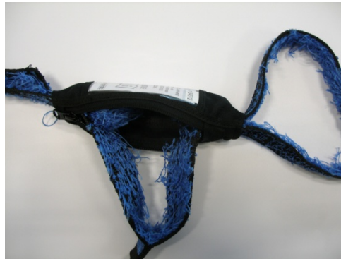
Fig. 4 Absorbeur d'énergie déployé

Si la longe a stoppé une chute, l'absorbeur d'énergie est déployé et la longe doit être rebutée, voir Fig. 4.