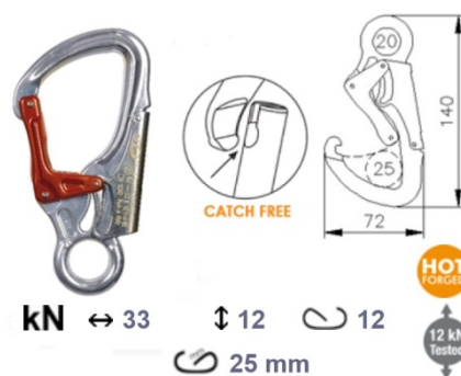
Fig. 3 Connecteur à ouverture par double actions HAR025